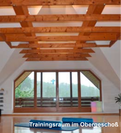
Trainingsraum im Obergeschoß