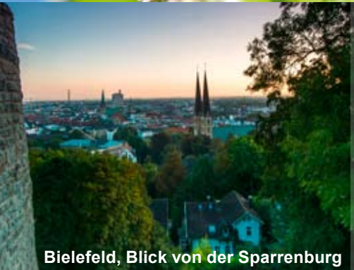
Bielefeld, Blick von der Sparrenburg