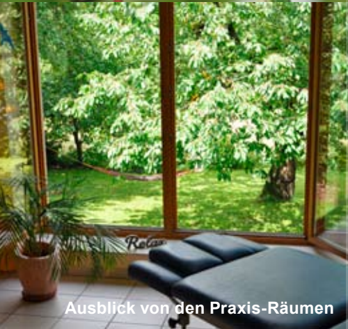
Ausblick von den Praxis-Räumen