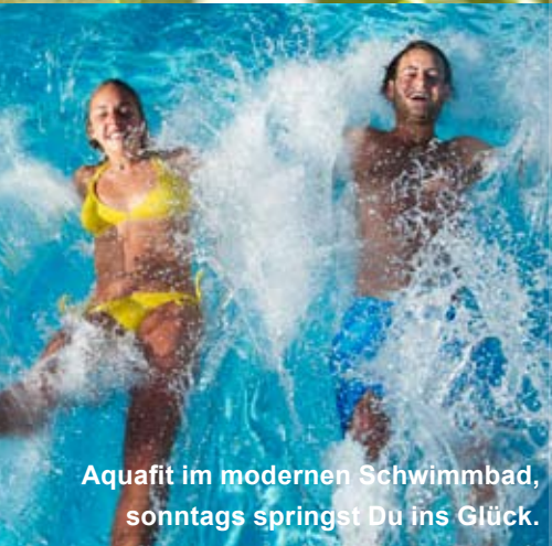
Aquafit im modernen Schwimmbad, sonntags springst Du ins Glück.