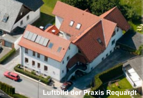
Luftbild der Praxis Requardt